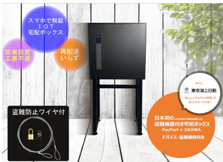
スタートダッシュ・キャンペーン対象 IoT 宅配ボックス

物流業界のラストマイル問題を解決するソリューションベンダーである株式会社 PacPort（本社：東京、代表取締役社長：沈 燁、以下「PacPort」）は、この度、株式会社エリア・パーキング（本社：東京、代表取締役 横倉 清司、以下「エリア・パーキング」）、株式会社大川（本社：神奈川県横浜市、代表取締役：大川 浩逸、以下「OKAWA」）とタッグを組み、IoT 宅配ボックスのサブスクリプションサービスを本日 10 月 1 日より、横浜市都筑区にて展開すると同時に、スタートダッシュ・キャンペーンを開始させました。先着申込み 100 個分については、最初の 3 か月間はサービス使用料が無料、4 か月目から月額 500 円（税込）で継続使用できます。